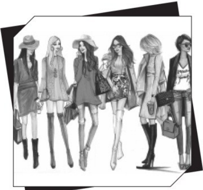
FASHION ILLUSTRATOR Quality Controller