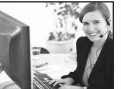
ഇൻഫോമേഷൻ സർവ്വീസ് മാനേജർ

ലോകത്തെമ്പാടുമുള്ള വാണിജ്യവ്യവസായ രംഗത്തുള്ള ലോജിസ്റ്റിക്സ് മേഖലയിൽ ഇൻവെന്ററി മാനേജർ, വെയർ ഹൗസ് മാനേജർ, ലോജിസ്റ്റിക്സ് മാനേജർ തുടങ്ങി ലക്ഷക്കണക്കിന് തൊഴിലവസരങ്ങളാണ് ഉള്ളത്. ഷിപ്പിംഗ് & ലോജിസ്റ്റിക്സ് മേഖലകളെ കുറിച്ചും, കോഴ്സ് പൂർത്തിയാക്കി SRC, Kerala യുടെ അഡ്വാൻസ്ഡ് ഡിപ്ലോമ സർട്ടിഫിക്കേഷൻ പൂർത്തിയാക്കിയ വിദ്യാർത്ഥികൾക്ക് ലഭിക്കുന്ന തൊഴിലവസരങ്ങളെ കുറിച്ചും അറിയുവാൻ താൽപ്പര്യമുള്ള രക്ഷകർത്താക്കളും വിദ്യാർത്ഥികളും താഴെപ്പറയുന്ന ഹെൽപ്പ്ലൈൻ നമ്പറുമായി ബന്ധപ്പെടേണ്ടതാണ്.