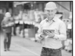
ഇംപോർട്ട് & എക്സ്പോർട്ട് മാനേജർ