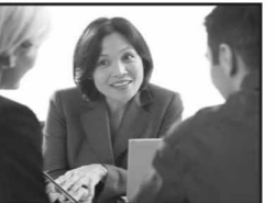
ക്സ്റ്റമർ സർവ്വീസ് മാനേജർ